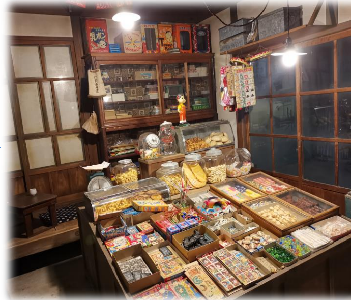
「昭和のくらし」というコーナーで展示しているの売場

例え、秋の時には家の中に椅子と机だけあるけど冬になると机の上に冬のコートや手袋を置くこともある。何度来館しても忠実に生きてる人がいるが感じられる。年配の人に対してそれはまるで自分の若い時代に戻ってタイムスリップしているようだ。